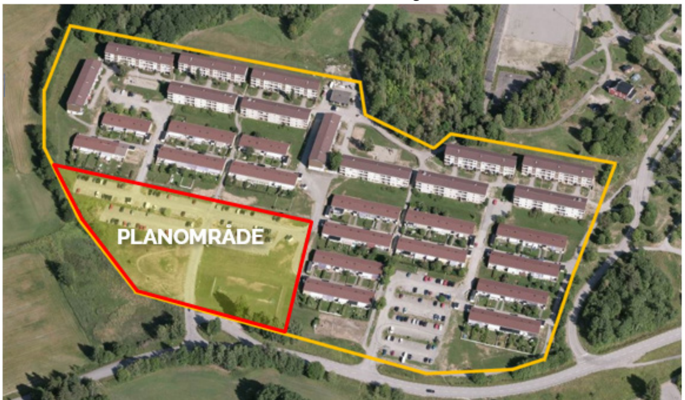
Foto över fastigheten mot öster

Syftet med detaljplanen är att inom aktuell fastighet uppföra nya flerbostadshus. Detta genom att tillvarata och omvandla outnyttjade markresurser som finns inom fastigheten.