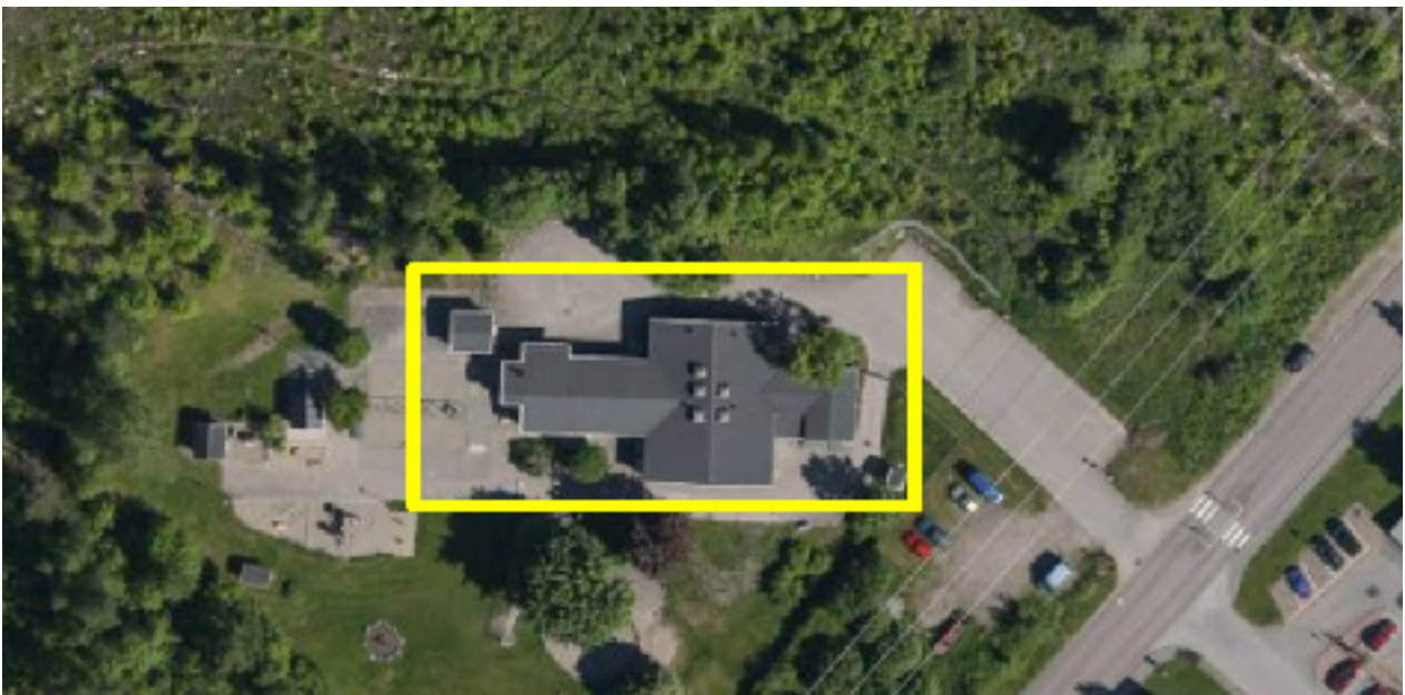
Skogsbackens förskola, Bosvedjan

Planändringen syftar till att pröva möjligheten att ändra den tillåtna byggnadshöjden som idag är en våning, för att möjliggöra en ny förskolebyggnad med två våningar.