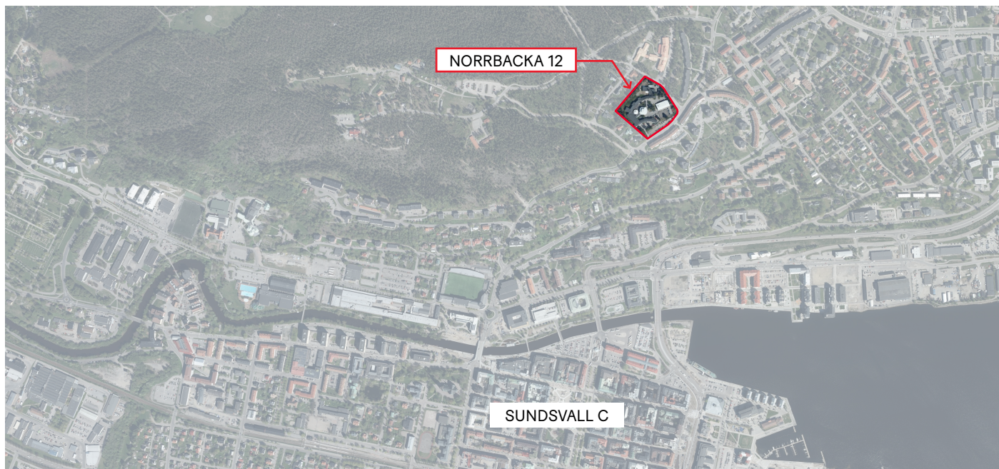
Planområdets lokalisering och avgränsning markerad.

Granskningstid: 19 feb 2026 - 12 mars 2026