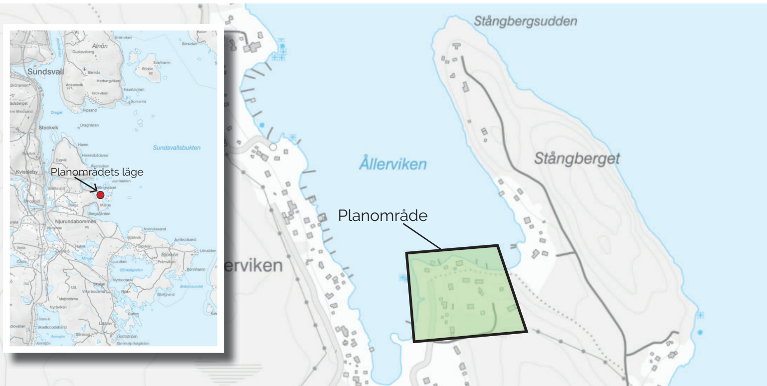
Planområdets lokalisering och avgränsning markerad.